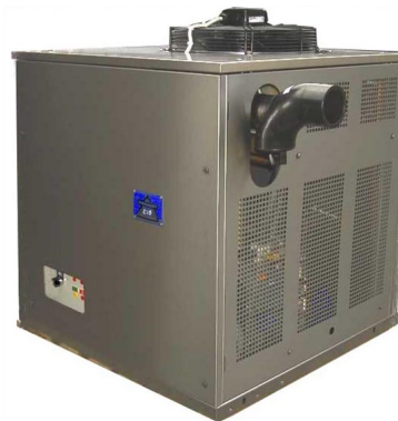
...in einem robusten Edelstahlgehäuse