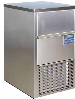
...in einem robusten Edelstahlgehäuse