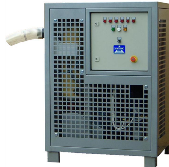
... in industrieller Ausführung.